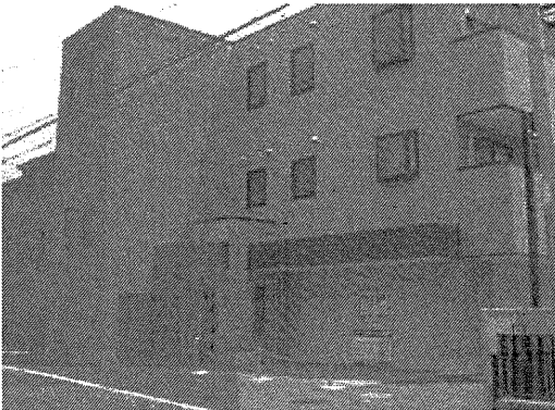
室内・設備・周辺写真